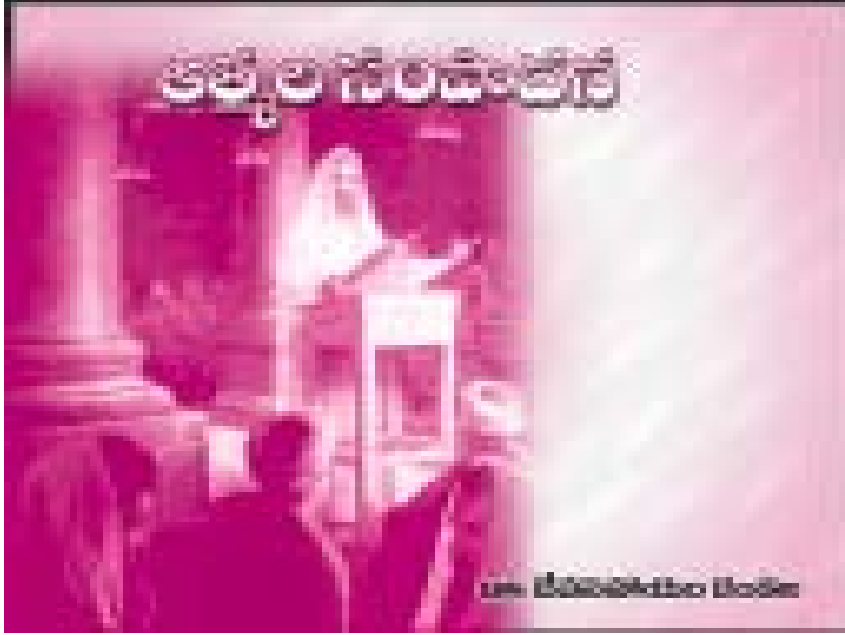
“నా వెంబడి రండి, నేను మిమ్మును మనుష్యులను పట్టు జాలరులనుగా చేతును” మత్తయి 4:19.

యేసు ప్రజల్ని రక్షించడానికి వచ్చాడు. అది ఆయన లక్ష్యం. కార్యం. తనను అనుసరించడానికి యేసు ఎన్నుకున్న మొదటి వర్గం వారు ఈ పై వచనం యొక్క సవాలును అందుకున్నారు. మత్తయి 4:19 అలాగే ఆయన ఆరోహణమయ్యే వరకు ఆయనను వెంబడించిన చివరి వర్గం వారు ఈ ఆదేశాన్ని పొందారు.” కాబట్టి మీరు వెళ్ళి సమస్తజనులను శిష్యులను చేయండి.” మత్తయి 19:20.