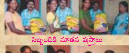
సిబ్బందికి నూతన వస్త్రాలు