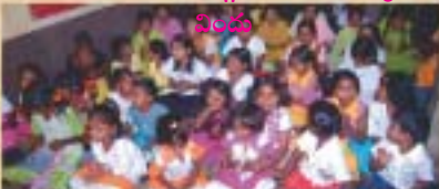
పిల్లలందరికీ నూతన వస్త్రాలు