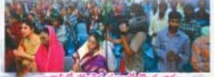
అబుదాబిలో వార్షికోత్సవం ప్రారంభం కోసం వాక్