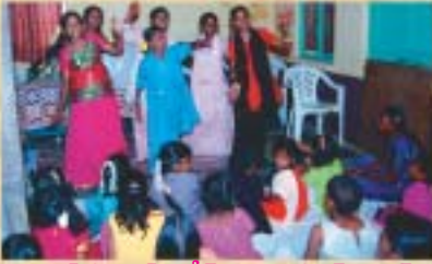
లిటిల్ ఏంజల్ హోమ్ పిల్లల ఏకన్ సాంగ్