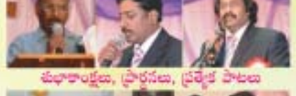
మధ్యాహ్నం ప్రార్థనలు, ప్రత్యేక పాటలు