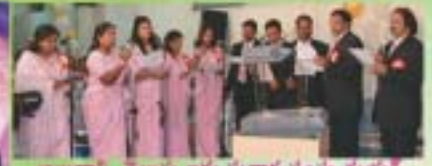
అబుదాబి, తెలుగు ఐక్య సువార్ల సంఘ శ్రీమతి