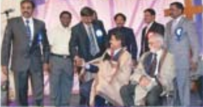
హాజరులను సోదర, సోదరిలు