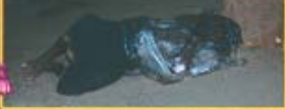
కబేకనేలమీద దోమలు కుట్టుకుండా తలమీద మాత్రం పాస్టిక్ షీట్ కప్పకునిఉన్న ఈ వ్యక్తిని చూచాము

అలాగే విజయవాడ దగ్గరలోని లెప్రసీ కాలనీ వాసులను దర్శించి ప్రార్థించి వారికి దుప్పట్లు, చీరలు పంచటానికి ప్రభువు కృపచూపారు. వారిలో కొంత మందికి ప్రతినెలా స్పందన వెడుతుంది. ఆ విషయం ముందు తెలియదు గాని అక్కడకు వెళ్లాక తెలిసింది. వీరికి ప్రతినెలా బియ్యం, నూనెలు మొ॥ నిత్యావసర వస్తువులు కావాలి. ప్రార్థించండి. ప్రభువు వసరులు సమకూర్చిన కొలది వీరికి సాయ పడాలని ఆశిస్తున్నాము. న హ క రించిన మీ సోదరుడు అందరికీ వందనములు దైవ ప్రసాదం