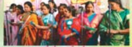
సహాయక ప్రత్యేక గీతాలు