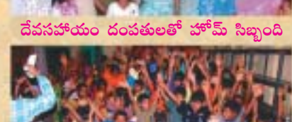
దేవసహాయం దంపతులతో హోమ్ సిబ్బంది