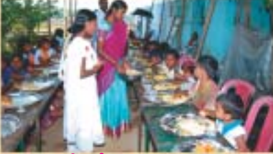
కండ్రికతో హోమ్ దగ్గర పిల్లలకు క్రీస్తును విందు