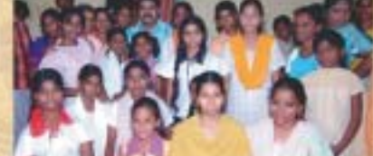
దేవసహాయం గారితో పిల్లలు