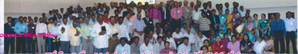
జెబెల్ అలిలో జరిగిన సంఘనాయకులు, పాస్టర్ల ప్రత్యేక సమావేశం