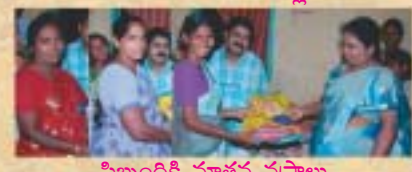
సిబ్బందికి నూతన వస్త్రాలు