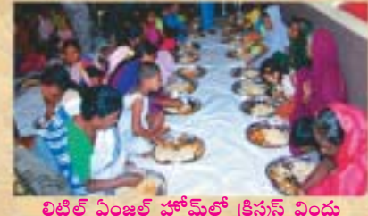
లిటిల్ ఏంజల్ హోమ్ లో క్రీస్తును విందు