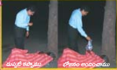
దుప్పటి కప్పాము భోజనం అందించాము

సముద్రంలో చిన్న బొట్టెంత ఈ సాయం! దేవునిబద్దలా, ఈలాంటివారి కోసం మీరు కాకపోతే ఇంకెవరు ప్రార్థిస్తారు? సాయం చేస్తారు? దేవుని సంఘం ఈలాంటి వారికోసం ప్రార్థించటం మరచిపోయింది.