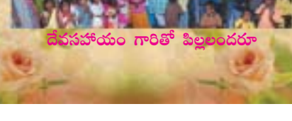
దేవసహాయం గారితో పిల్లలందరూ