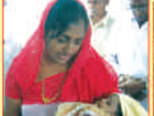
తల్లిబిడ్డలు తమను కుడా ప్రార్థనలకు వేచివున్నారు