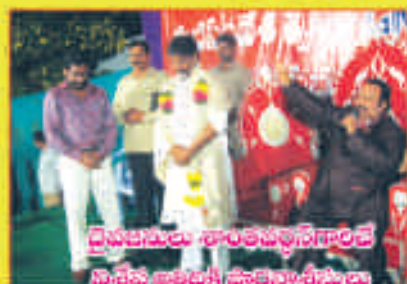
దైవజనులు శాంతవర్ధన్ గారిజే నిశేష అంజలి ప్రాధాన్యం ఆరీస్పణ