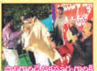
పూర్తిగాలదే ప్రకాశాచారి గాంధీ సన్మానం