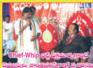
Chief-Whip ధర్మ పక్షమాత్యగాంజే దైవజనులు శాంతవర్ధన్ గారికి దండంబలు