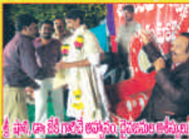
శ్రీ ఫలీ, డా॥ శ్రీ గజలే ఆహ్వానం దైవజనుల ఆరీస్పణ