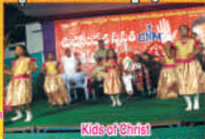
Kids of Christ అనాధ-చరచాలయ బద్ధుల సృష్టి ప్రదర్శన