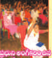
ప్రభుని అంగీకరించిన వేలామంది