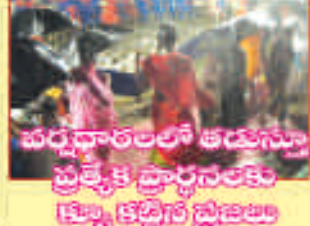
పర్వతారలలో తమను ప్రత్యేక ప్రార్థనలకు క్రొత్త కట్టిన ప్రజలు