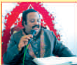
చిన్నాలో ఉపసభాసభలం ప్రజాసభి