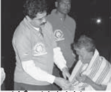
దుప్పటి అందుకుంటున్న వృద్ధురాలు