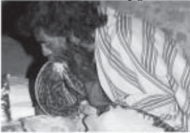
ఆత్రంగా భోంచేస్తున్న వృద్ధబిడ్డవుడు