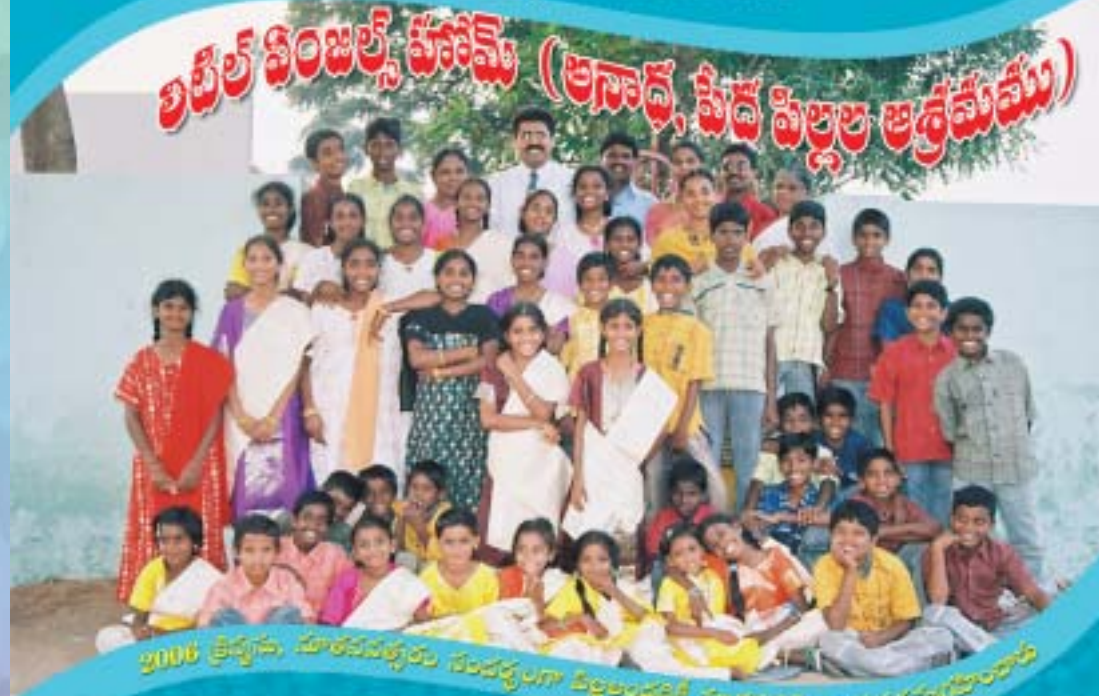
2006 క్రైస్తవ, మతపరమైన సంబంధంగా పిల్లలందరికీ మతపరమైన ప్రభుత్వం

శ్రేష్టమైన ఈ చిన్న పిల్లల పరిచర్యకోసం మీ వ్యక్తిగత, కుటుంబ, సంఘ ప్రార్థనలు కోరుతున్నాము. వీరి కోసం ప్రార్థించండి. ఒక బద్దను మీరు పోషించగలిగితే వారికయ్యే ఖర్చును ప్రతినెలా మీరు పంప వచ్చును. దయచేసి ప్రార్థించండి. దేవుడు మిమ్ములను ప్రేరేపిస్తే మీ సేవాకానుకలు పంపి సహకరించండి.