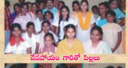
దేవసహాయం గారితో పిల్లలు