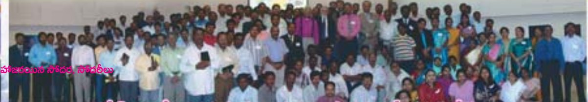
జెబెల్ అలిలో జరిగిన సంఘనాయకులు, పాస్టర్ల ప్రత్యేక సమావేశం