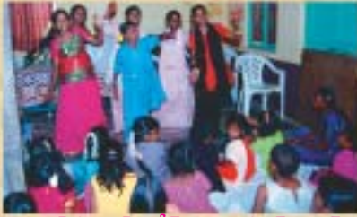
లిటిల్ ఏంజల్ హోమ్ పిల్లల ఏకన్ సాంగ్