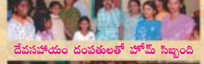
దేవసహాయం దంపతులతో హోమ్ సిబ్బంది