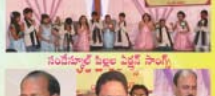
సందేశాల్లో బిడ్డల పెద్దల సాంగ్