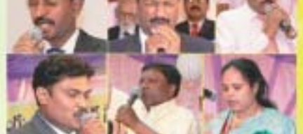
శుభాకాంక్షలు, ప్రార్థనలు, ప్రత్యేక పాటలు