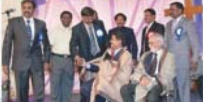
హాజరులను సోదర, సోదరిలు