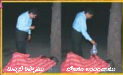
దుప్పటి కప్పాము భోజనం అందించాము

సముద్రంలో చిన్న బొట్టించ ఈ సాయం! దేవునిబద్దలారా, ఈలాంటివారి కోసం మీరు కాకపోతే ఇంకెవరు ప్రార్థిస్తారు? సాయం చేస్తారు? దేవుని సంఘం ఈలాంటి వారికోసం ప్రార్థించటం మరచిపోయింది.