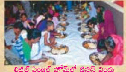
లిటిల్ ఏంజల్ హోమ్ లో క్రీస్తును విందు