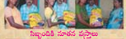
సిబ్బందికి నూతన వస్త్రాలు