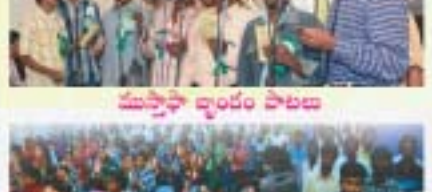
అబుదాబిలో వార్షికోత్సవం ప్రారంభం కోసం దాగ్