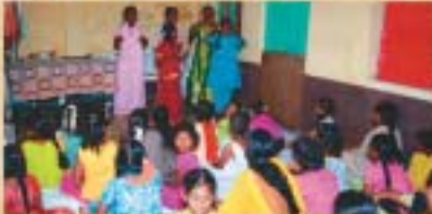
పిల్లల మరో ఏకన్ సాంగ్