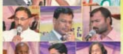
శుభాకాంక్షలు, ప్రార్థనలు, ప్రత్యేక పాటలు