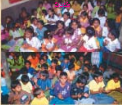
పిల్లలందరికీ నూతన వస్త్రాలు