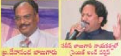
ప్ర.దేవానంద బాబుగారు, పేజీది తాబాగారి సామెతల్లో ప్రజలకి అంది చర్చి