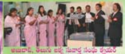
అబుదాబి, తాబాగారి సామెతల్లో సువార్ల సంఘ శ్రీమతి