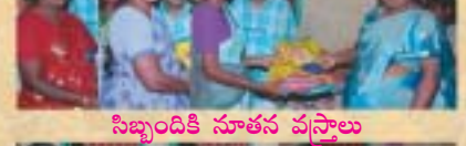
సిబ్బందికి నూతన వస్త్రాలు