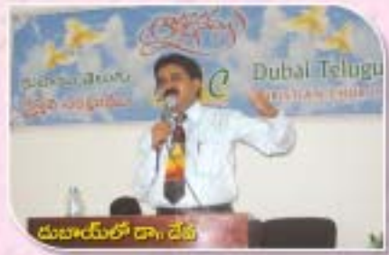
దుబాయ్ లో డా. జేపీ