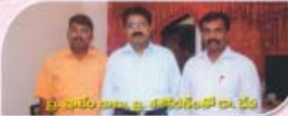
షార్దూల్ కల్యాణ్ కల్యాణ్ కల్యాణ్ డా. జేపీ