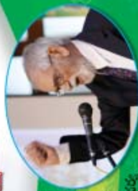
లండన్, షార్జాలలో అరారే గౌరి వాళ్ళ వరివర్ణ